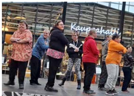
Tanssiesitys aloitti Etelä-Savon Tukipiirin Teemaviikon tapahtuman Kauppakeskus Stellassa 2.12.2022.

Teemaviikolla 38 kehitysvamma-alan toimijaa toteutti tapahtumia Tukiliiton tuella. Tapahtumien joukossa oli taidenäyttelyitä, erilaisia kulttuuriesityksiä, illanviettoja sekä keskustelutapahtumia. Osa tapahtumista toteutettiin etätapahtumina. Viikon teema, eli asenteet kehitys-