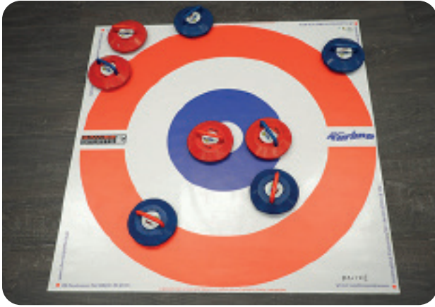
Kuvassa punaiset voittivat erän 2 – 0.