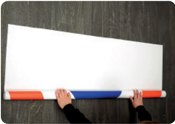
Pelin jälkeen matto käännetään takaisin rullalle kuvapuoli ulospäin.