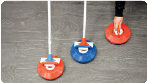
Curling-kiveä voi työntää kädellä tai työntimellä.