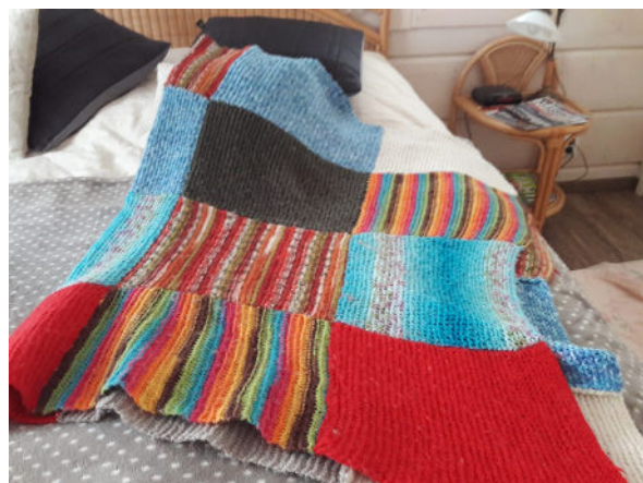
Eveliinan tekemä torkkupeitto