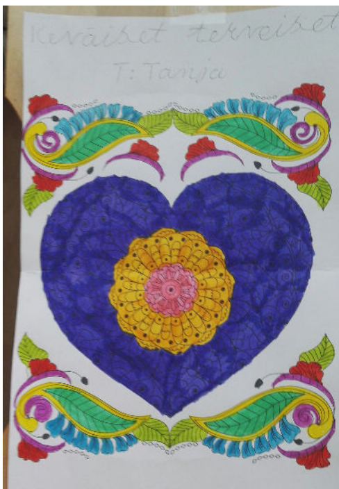
Tanja lähettää keväisiä terveisiä lehden lukijoille!