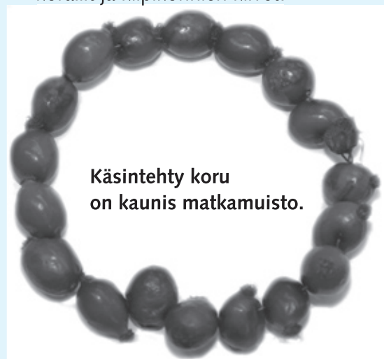
Käsintehty koru on kaunis matkamuisto.