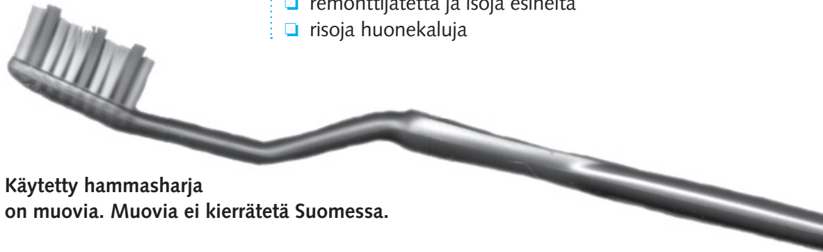
Käytetty hammasharja on muovia. Muovia ei kierrätetä Suomessa.

Kuivajätettä tulee vähän, jos ostat mahdollisimman vähän pakattuja tavaroita ja suositt kierrätettäviä materiaaleja.