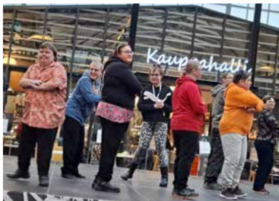
Tanssiesitys aloitti Etelä-Savon Tukipiirin Teemaviikon tapahtuman Kauppakeskus Stellassa 2.12.2022.

Teemaviikolla 38 kehitysvamma-alan toimijaa toteutti tapahtumia Tukiliiton tuella. Tapahtumien joukossa oli taidenäyttelyitä, erilaisia kulttuuriesityksiä, illanviettoja sekä keskustelutapahtumia. Osa tapahtumista toteutettiin etätapahtumina. Viikon teema, eli asenteet kehitys-